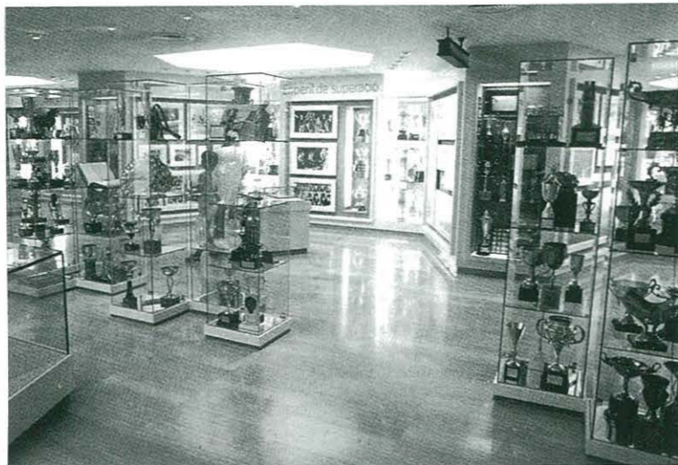
Els obsequis i trofeus concedits per les entitats esportives més prestigioses del món són uns dels millors al·licients de la visita al Museu

Aquest any passat la Penya va fer un regal de Nadal a tots els Socis que ho varen desitjar, el regal per així dir-ho consistia en organitzar un viatge, però no un de qualsevol, sinó una excursió per visitar les instal·lacions del millor club de futbol del món, el nostre estimat "BARÇA". La sortida va començar molt prompte, a les 7 del matí, però valia la pena passar una mica de son, us ho asseguro. Vàrem sortir de la plaça de l'església i després d'un viatge sense aturades, vam arribar a l'estadi. I havia una bona cua, és normal tothom vol